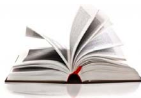
UN LIVRE/ UN BOUQUIN